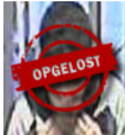
Amsterdam Overval sigarenzaak 1 februari